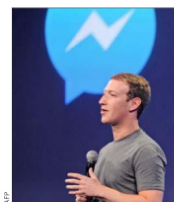
Mark Zuckerberg, CEO de Facebook, durante la presentación de una nueva plataforma de Messenger en San Francisco, en marzo de 2015.

Investigadores de la U. de San Diego y del Instituto Tecnológico de Massachusetts (MIT) manipularon una bacteria para producir medicamentos contra el cáncer y luego autodestruirse, liberando el fármaco en el lugar donde se encuentran los tumores.