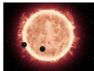
El dibujo muestra a los dos exoplanetas pasando delante de su estrella anaranja, más pequeña y fría que nuestro sol.

La aplicación móvil de mensajería Messenger, que pertenece a Facebook, anunció ayer que superó la barrera simbólica de los mil millones de usuarios. Con esta cifra, la red social cuenta ahora con dos servicios de mensajería con más de mil millones de usuarios, ya que WhatsApp, adquirida por ella en 2014, también superó esa barrera este año. Entre los grandes países que más utilizan Messenger están EE.UU., Australia, Tailandia, Filipinas, Francia, Inglaterra, y globalmente Europa, salvo Alemania y España, donde predomina el uso de WhatsApp.