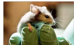
La técnica fue probada por científicos del MIT en un modelo animal de ratones con metástasis colorrectal.