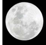
Un objeto tan grande como un protoplaneta habría sido el causante del cráter de 1.200 kilómetros de diámetro en la zona norte de la Luna.

El mar de la lluvia, esa mancha negra que se ve en la parte noroccidental de la Luna, pudo ser causado por un asteroide de un tamaño similar al de un planeta en formación, que además se rompió cuando chocó contra el satélite. El objeto, que golpeó la Luna hace 3.800 millones de años, debía medir unos 250 kilómetros de diámetro y no los 80 que se creía hasta ahora, según un estudio basado en nuevas observaciones y modelos computacionales creados por investigadores de las universidades de Brown y Alburquerque.