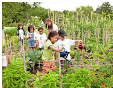
Realizar alguna clase en el patio del colegio o hacer visitas a terreno, como el trabajo en un huerto, ayudaría a favorecer el desarrollo y aprendizaje escolar.

Investigaciones previas ya han remarcado la importancia, por ejemplo, de que haya espacios verdes cerca de las escuelas, ya