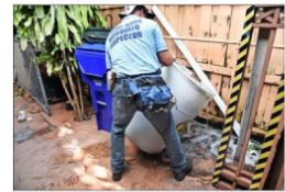
Los inspectores del centro de control de mosquitos van casa por casa fumigando y vaciando agua estancada.

"Con tanto énfasis en el logro académico, no es sano que se presione a los profesores a permanecer en el aula, porque esto significa que los niños se están perdiendo de tantas experiencias que los beneficiarían a lo largo de sus vidas". En el estudio, los autores sugieren cómo los gobiernos pueden basarse en la investigación existente para introducir el aprendizaje al aire libre como un elemento más de las políticas locales de educación.