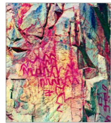
Estos diseños en color rojo fueron hallados en las inmediaciones de Ovalle. Las pinturas se hicieron con materiales orgánicos y carbón. Esto último permitió fecharlas, lo que no es habitual.

Este arte rupestre surge en la zona cuando había mucha gente viviendo ahí y habrían comenzado las reclamaciones territoriales. "Lo habitual es que los cazadores recolectores estén en movimiento, pero si hay mucha demanda