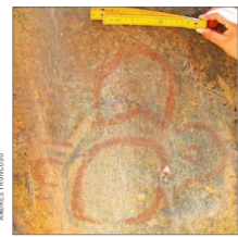
Círculos y otras figuras geométricas registradas en el sector de La Placa.

por el espacio, disminuyen los rangos de desplazamiento y la gente empieza a desarrollar un grado de territorialidad más fuerte, viene en forma más recurrente a los mismos lugares y se hace más necesario marcar cuál territorio corresponde a una comunidad determinada", detalla.