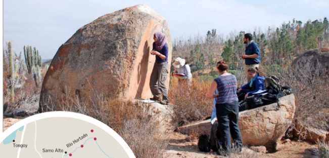
El equipo de arqueólogos liderado por Andrés Troncoso trabajó documentando los diseños en el valle del Limarí durante varias temporadas.