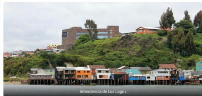
Intendencia de Los Lagos

Publicado por Carita Abarrca | La información es de Henry Burrows - Agencia France Presse