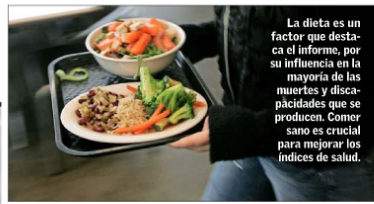
La dieta es un factor que destaca el informe, por su influencia en la mayoría de las muertes y discapacidades que se producen. Comer sano es crucial para mejorar los índices de salud.

Para el doctor Lavados, “esto demuestra que hay cosas que podemos hacer respecto de nuestra salud. Por ejemplo, ser responsables de cómo cuidamos nuestro cuerpo, que es algo crucial para mejorar estos índices de salud”.