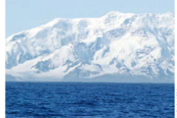
La falta de hierro en el agua es especialmente notoria alrededor de la Antártica.

La falta de hierro —obtenido normalmente desde la atmósfera— ha hecho que un tercio de los océanos del mundo estén anémicos, según indicó un estudio producido en Australia que también advierte que la situación es especialmente preocupante en la Antártica. El problema es importante porque el hierro actúa como un fertilizante natural de los mares, jugando un rol clave en el crecimiento del fitoplancton, que a su vez produce gran parte del oxígeno que se respira en el planeta y absorbe el dióxido de carbono. Las causas del fenómeno aún son desconocidas.