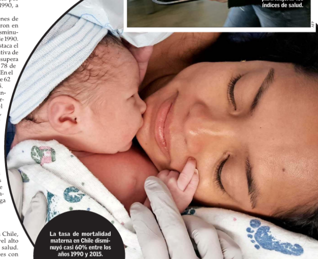
La tasa de mortalidad materna en Chile disminuyó casi 60% entre los años 1990 y 2015.

Sitios web y aplicaciones para celulares: