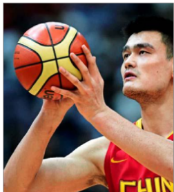
Entre los rostros escogidos para representar su programa espacial está el jugador Yao Ming.