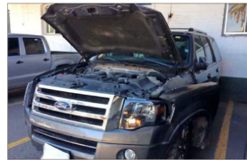
El vehículo incautado había sido acondicionado en el interior y exterior con habitáculos especiales para transportar la droga.