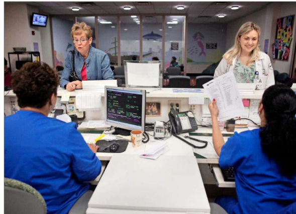
Las leyes protegen la privacidad de la información de salud del paciente, así como también establecen quiénes pueden tener acceso a las fichas médicas.

Así como se recurre a la autorización del paciente para utilizar