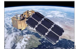
Los datos que proporcione Sentinel 2B serán gratuitos y estarán disponibles a través de internet.

El proyecto fue desarrollado por ingenieros e investigadores de la Paleobiology Database, la más grande base de datos en línea sobre descubrimientos de paleontología, y puede ser revisado en http://paleobiology.org/navigator .