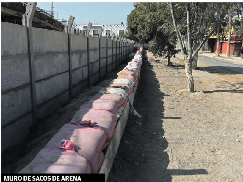
MURO DE SACOS DE ARENA

Han pasado dos meses tras las últimas lluvias y en calle Las Heras aún hay muro de sacos de arena. Más vale prevenir, dicen en el sector.