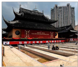
El edificio es especialmente sagrado por dos estatuas de jade de Buda traídas a China en 1882 desde Birmania.