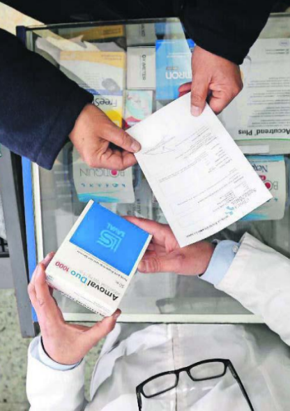
La exigencia de contar con una receta médica para la venta de antibióticos es una de las medidas que han tenido buenos resultados en el país con el fin de evitar el consumo abusivo de estos medicamentos.

"Hay que sacarse de la cabeza la idea de que todos los médicos usan bien los antibióticos"