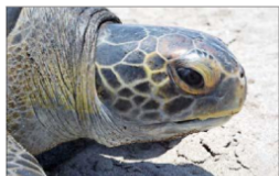
Chipre es una importante zona de reproducción para dos especies de tortugas marinas protegidas, la verde y la boba (en la foto).

Como es menor de edad, su mamá fue quien tuvo que firmar los papeles aceptando el nuevo contrato, asegura la página de noticias de ESPN.