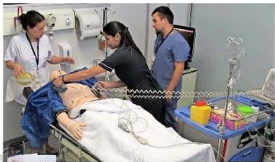
Centro de Simulación en el Hospital Padre Hurtado, campo clínico de la Facultad de Medicina, Clínica Alemana-Universidad del Desarrollo.