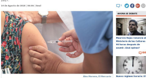
Reto Noticias, El Mercurio

SANTAGO. El último balance disponible del Ministerio de Salud sobre la campaña de vacunación contra el COVID-19 en Chile indica que hasta el momento, 2,27 millones de personas han sido vacunadas. De ellas, el 42% ha sido por infección o infección y el 58% por enfermedad respiratoria de alto riesgo.