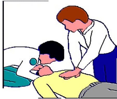
Resucitación Cardiopulmonar (RCP)

Este es el tipo de intervención que se administra a una persona que no respira y que no tiene latidos de corazón; se realiza con la intención de que vuelva a respirar y que de nuevo vuelva a latirle su corazón. Por lo general esta intervención implica que se administre respiración de boca a boca y que se hagan compresiones fuertes en el pecho para que el corazón vuelva a latir. Esta intervención también podría implicar que administren la descarga de un choque eléctrico (desfibrilación) o que introduzcan un tubo plástico por la garganta hasta la tráquea para ayudar a respirar (entubación).