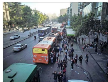
GASTOS.— Según el DTPM, el alza de los costos operacionales del sistema no incluyen los daños a buses, torniquetes y validadores durante la crisis.

Para la exministra de Transportes Paola Tapia, los dos últimos factores “dan lugar a una situación de alerta que esperamos pueda ser zanjada a la brevedad”.