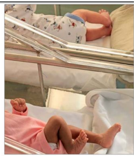
NACIMIENTOS.— Durante 2019, 31 mil hijos de madres extranjeras fueron inscritos en Chile durante el 2019.

Plantea que, por ejemplo, en Arica, “no menos del 40% de los partos que se atienden son de personas que no son residentes en Chile, sino que vienen, tienen su embarazo, están un tiempo y