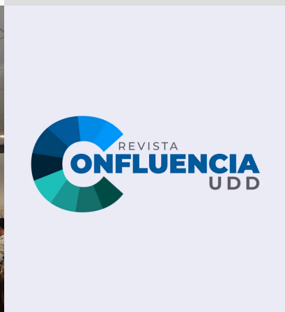
Revista Confluencia renueva su imagen