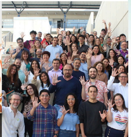
El Doctorado en Ciencias e Innovación en Medicina (DCIM) celebra su acreditación por 5 años