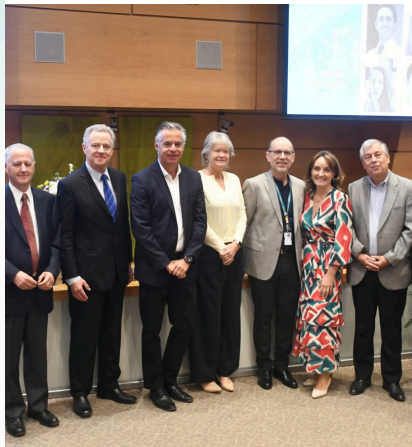
Inicio Año Académico 2024 en Clínica Alemana

Siete (7) años de certificación obtuvo la carrera de Kinesiología de la Universidad del Desarrollo, respaldando así la excelencia en la formación de nuevos profesionales de la salud, tanto en Santiago como en Concepción. Tras un año y medio de un trabajo minucioso, colaborativo y muy participativo, la Agencia ADC entregó el resultado de este proceso que se extenderá hasta marzo de 2031.