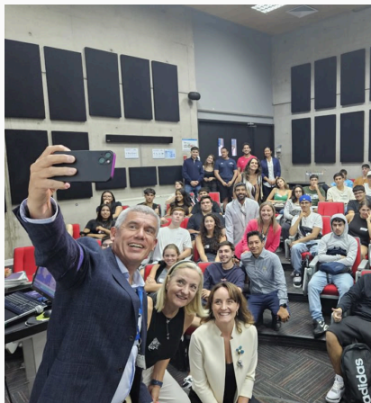
Facultad de Medicina y Universidad del Desarrollo dan la bienvenida a la generación 2024