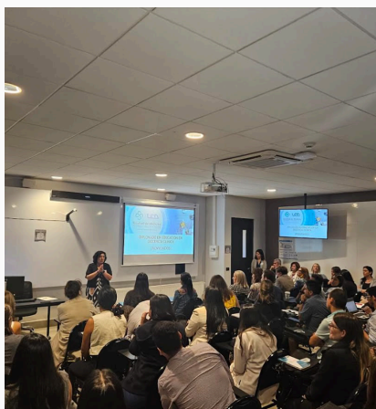
Inicia la XVII versión del Diplomado en Educación en Docencia Clínica UDD