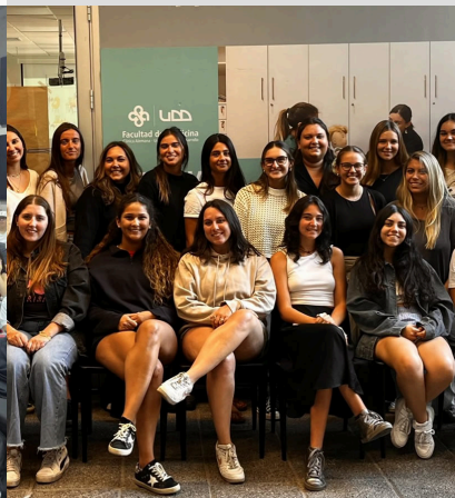
Primera generación de estudiantes de Terapia Ocupacional UDD listos para realizar sus Internados en Chile y en el extranjero