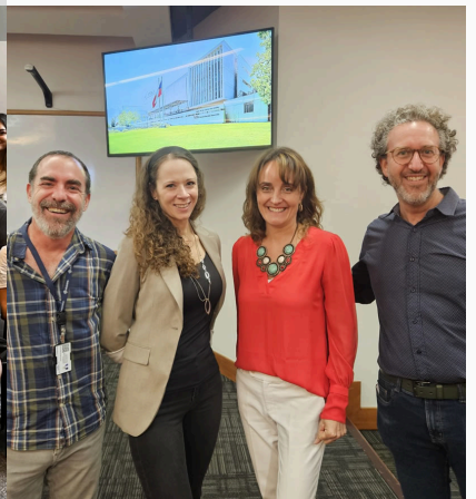
Investigadores del ICIM presentan sus líneas de investigación en una nueva Pasarela Científica