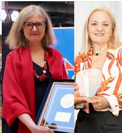
Académicas UDD reciben reconocimientos del Colmed en el marco del Día Internacional de la Mujer